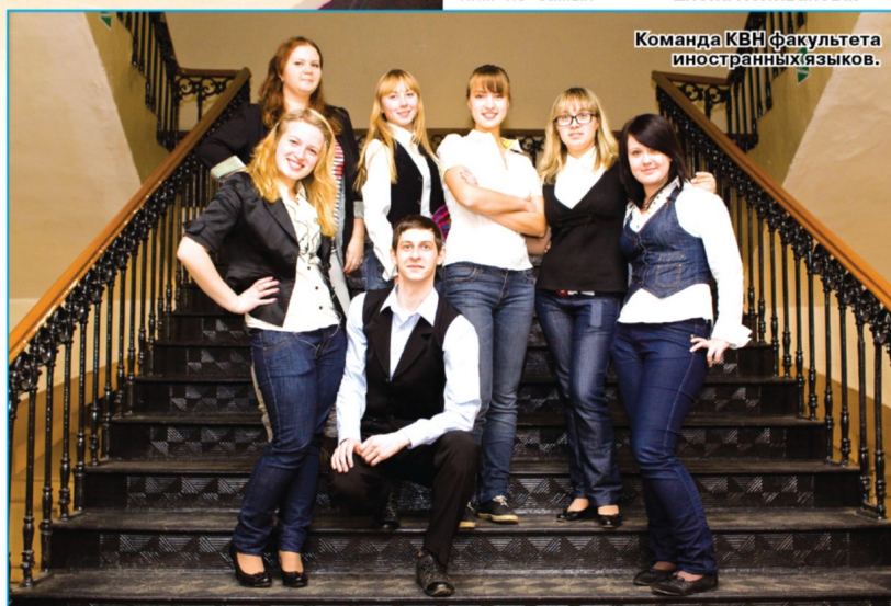
Команда КВН факультета иностранных языков.